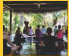
Yoga & Meditation Center