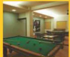
Facility for Indoor Games